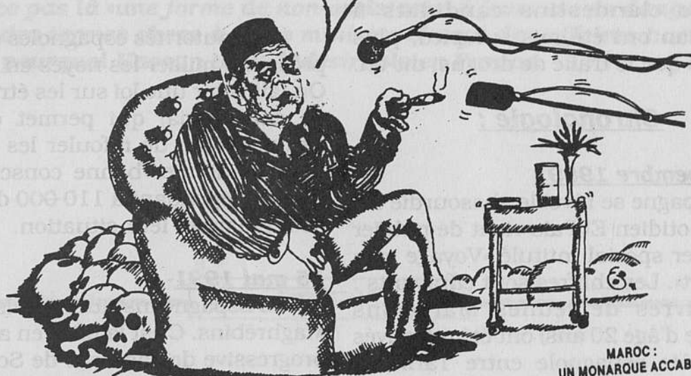
dessin : CLCRM et ASDHOM de Limoges.