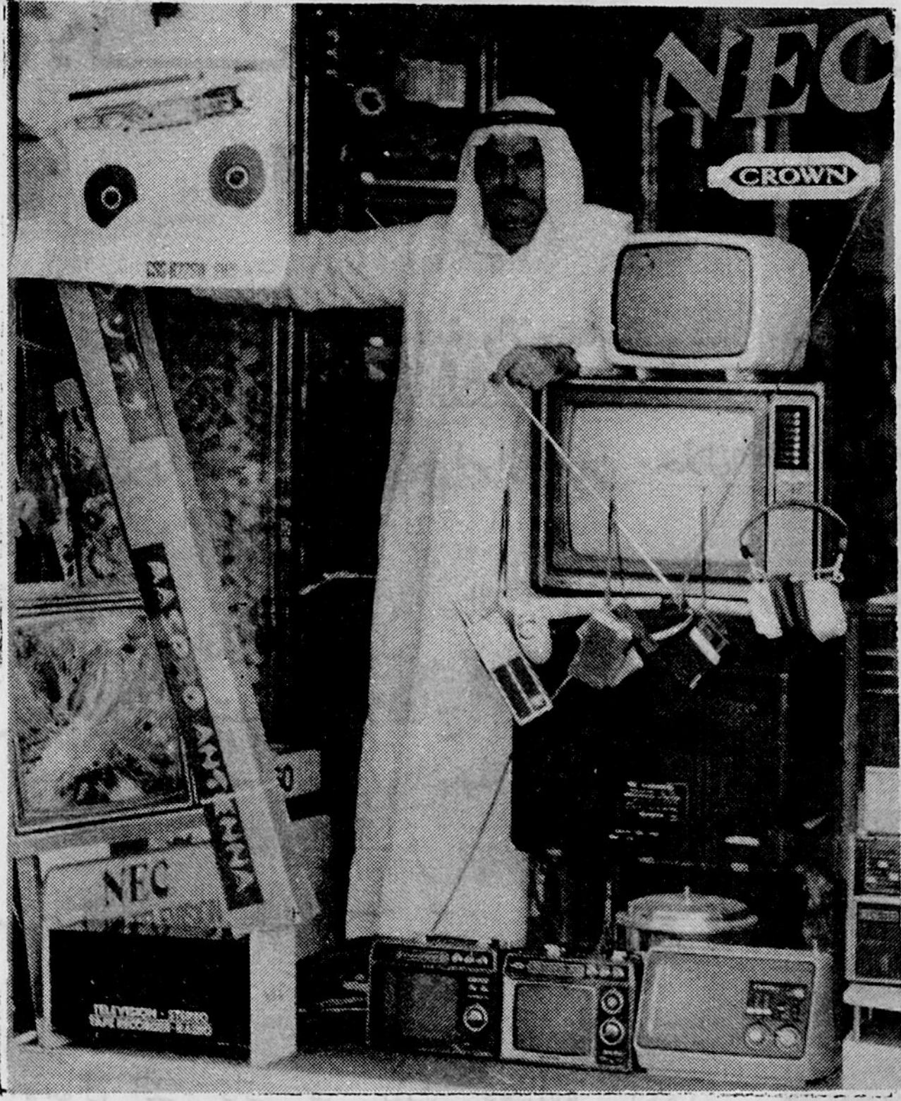
دكان في ابوظبي :