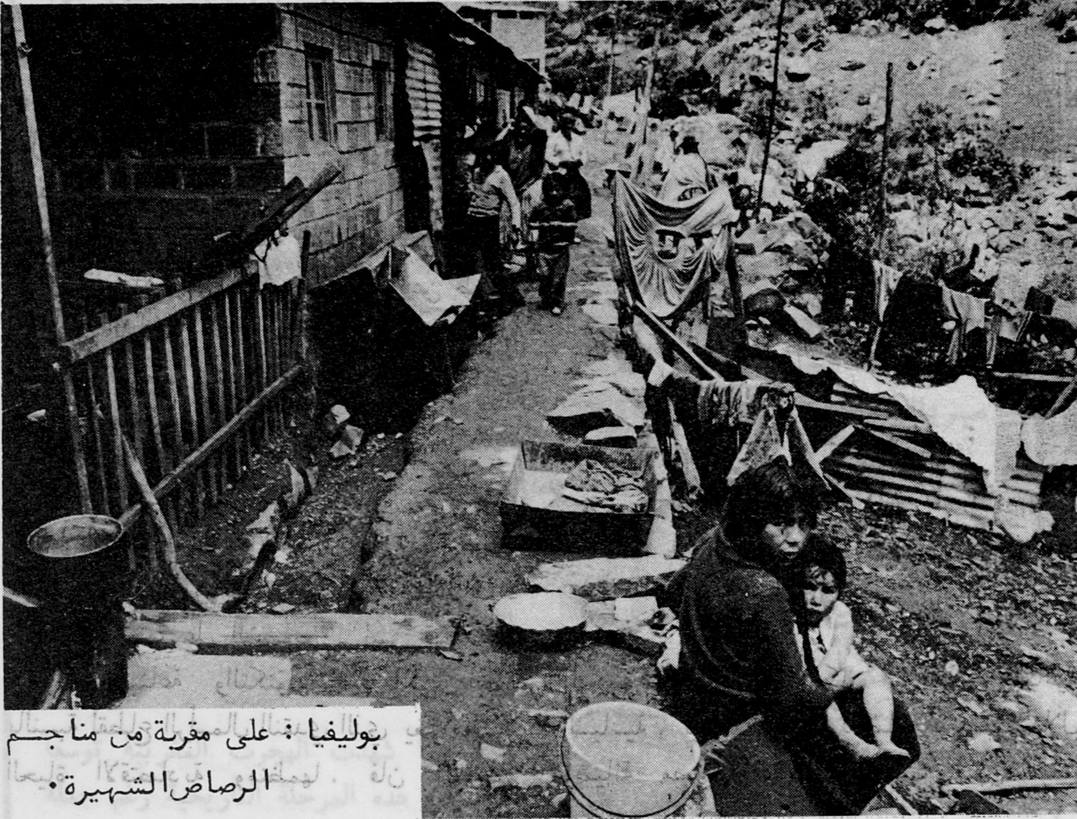
بوليفيا : على مقربة من مناجم الرصاص الشهيرة .

والملاحظ أيضاً ان ظاهرة تصدير رؤوس أموال تابعة للدولة قد اكتست أهمية لم تشهدا المرحلتان السابقتان سواء بالنسبة للبلدان المتقدمة فيما بينها او بالنسبة للبلدان النامية . وهذه ترجمة واضحة لتطور الرأسمالية الاحتكارية نحو