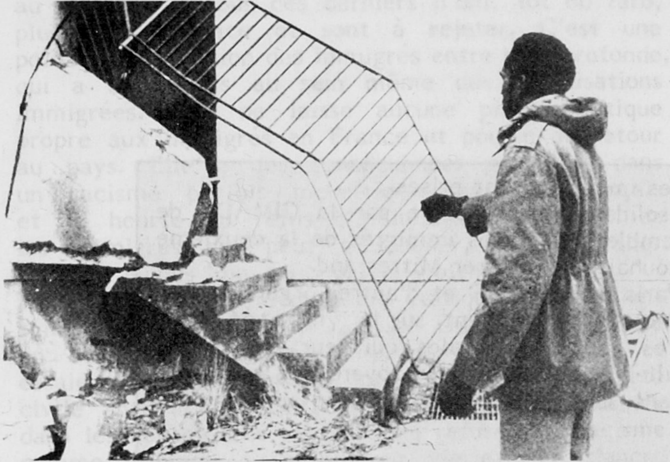
Ce n'est pas le résultat du passage d'un commando fasciste, mais du P.C.F. le 24 décembre 1980 à Vitry

Au delà des intérêts politiques des partis de gauche, une partie importante du peuple se sent interpellée par cette nouvelle arrivée électorale du Front National. Certains sont même effrayés. Beaucoup se souviennent avec précision de ce que l'extrême droite est capable de faire. Beaucoup savent ce que la démission collective face aux fascistes est capable d'entraîner. Mais il faut se méfier des réactions trop rapides, génératrices d'analyses politiques fausses. Se borner pour le moment à redouter une importance électorale grandissante des partis d'extrême droite en France, limite dangeu-