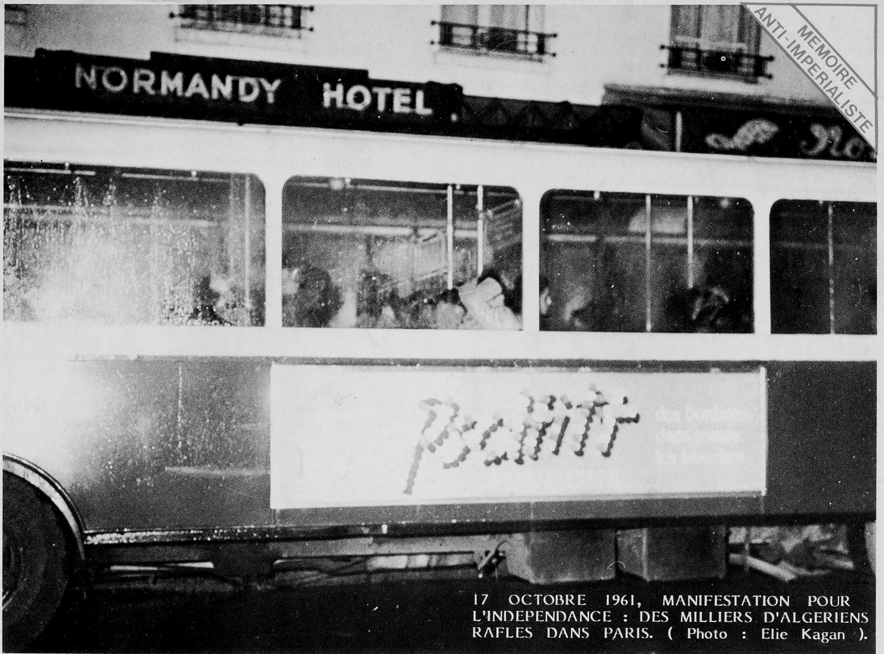
17 OCTOBRE 1961, MANIFESTATION POUR L'INDEPENDANCE : DES MILLIERS D'ALGERIENS RAFLES DANS PARIS.