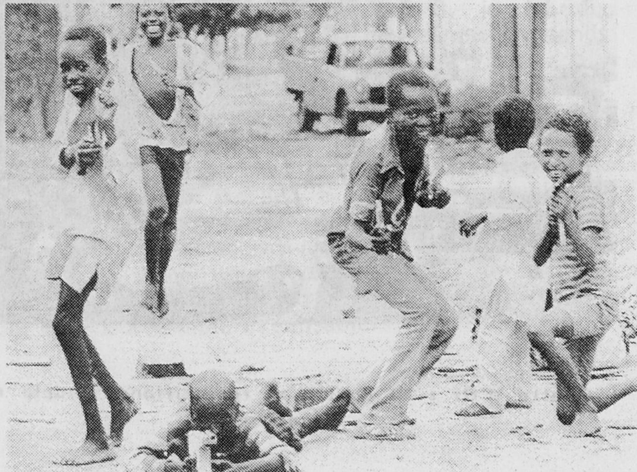
Le peuple tchadien pris dans la guerre

* On ne peut pas comme le font les trotskistes exiger le départ des troupes françaises d'Afrique sans prendre en compte la situation mondiale dominée par les risques de guerre et les menées des deux super-puissances.