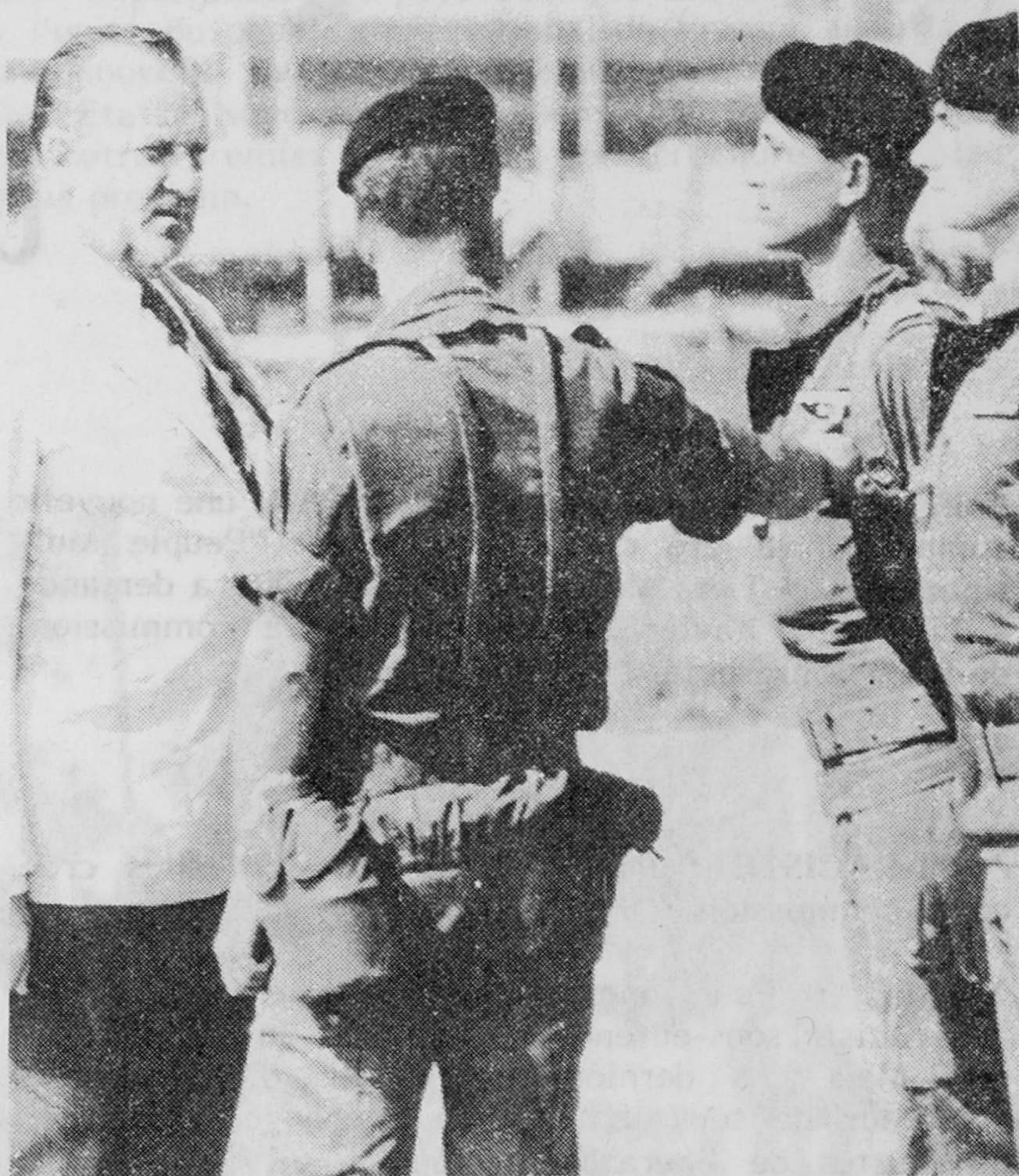
Une action armée pour préserver les intérêts impérialistes français

Chacun connaît les multiples liens existant entre les communautés en France et celles des pays d'origine. Ce qui se passe ici est discuté, commenté là-bas. De même, les comportements entre communautés là-bas ne restent pas sans effets ici. Les tensions provoquées en France par la situation au Moyen-Orient ou par les émeutes au Sri-Lanka sont là pour nous