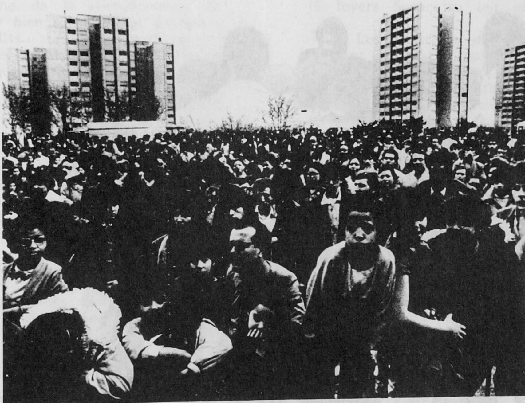
Aux Minguettes : un peuple multinational