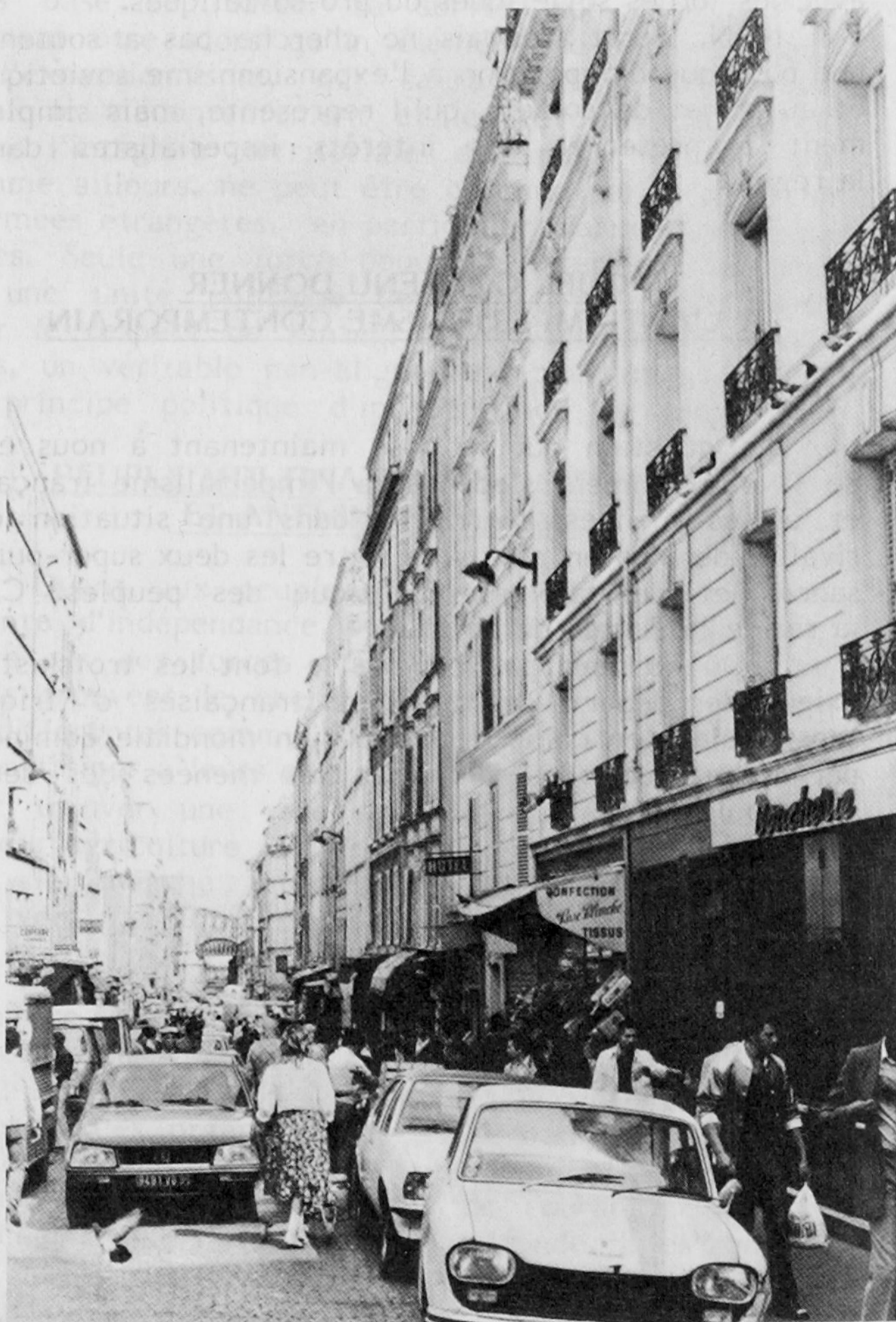
Goutte d'Or : Ni ghetto ni répartition : peuple multinational