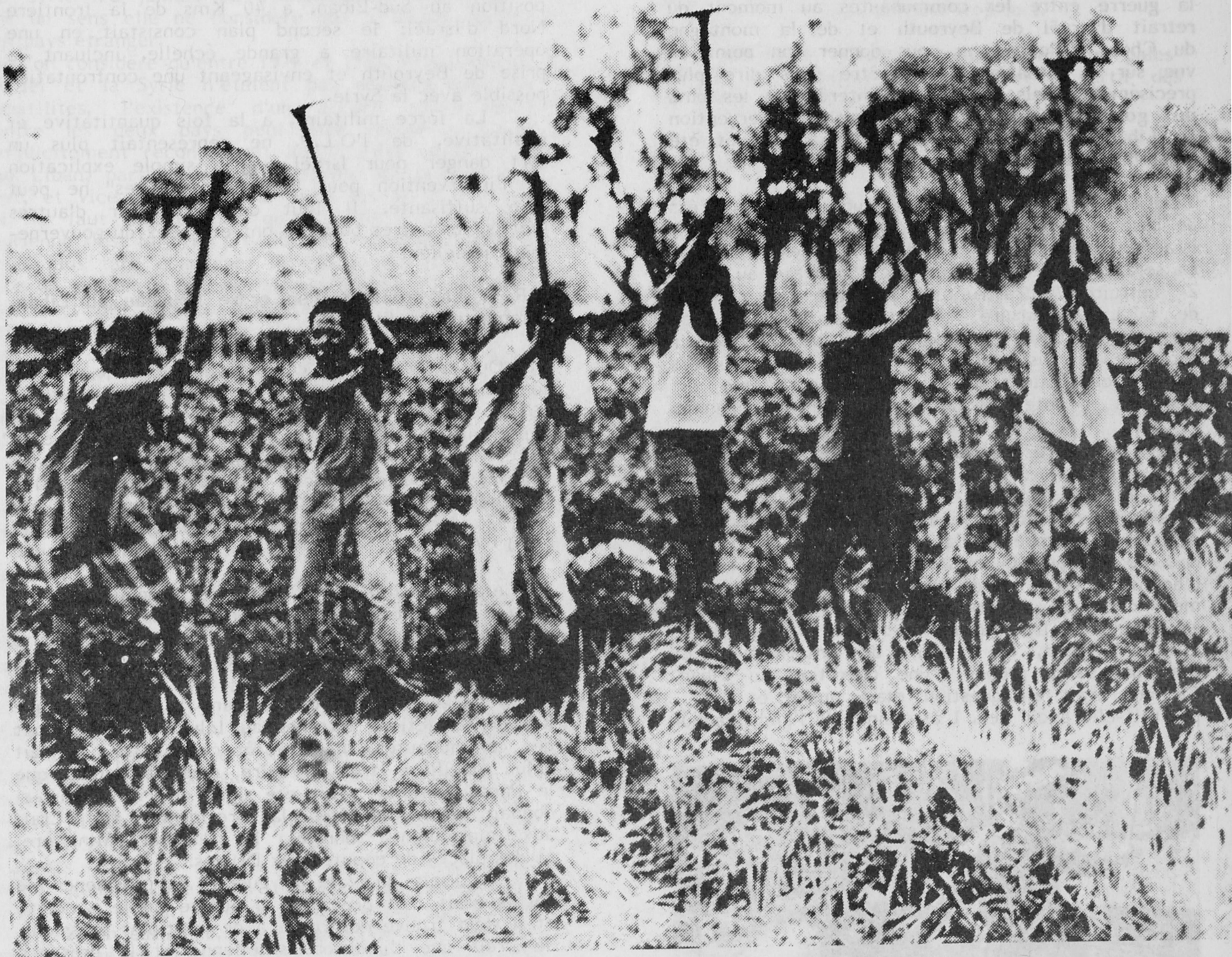
Des initiatives collectives à la campagne

E. : La commission se compose de camarades africains ouvriers et étudiants, d'anti-racistes, militants ou non. Elle est ouverte à tous ceux qui désirent apprendre l'histoire des peuples colonisés et néo-colonisés, qui veulent débattre les rapports entre pays impérialistes et pays du Tiers Monde, travailler à l'unité du peuple multinational de France, instituer une nouvelle forme d'internationalisme indépendante des Etats. Nous nous réunissons une fois par mois et notre premier travail : une brochure pour le mois prochain.