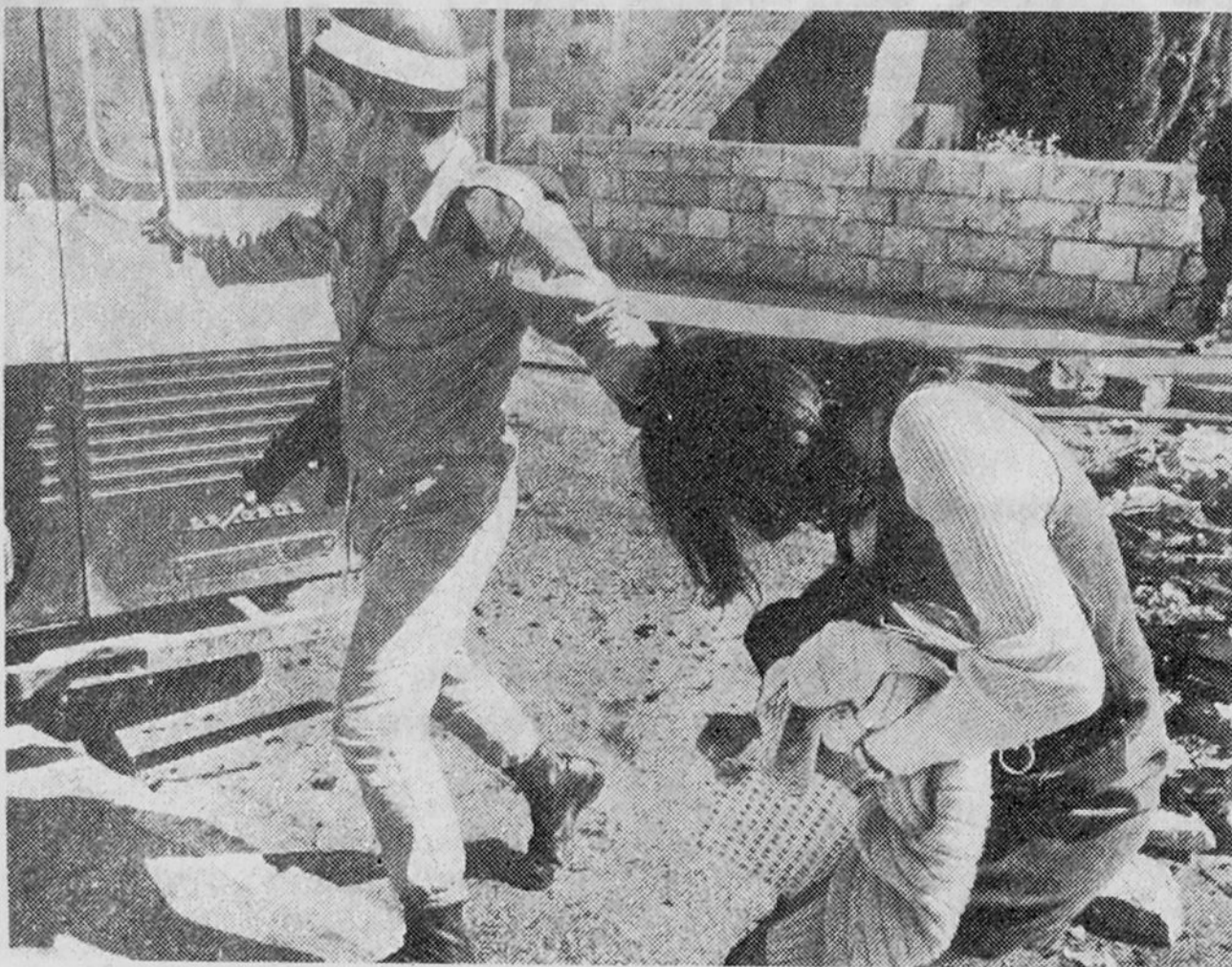
Dialogue à la manière israélienne

Y. : Je commence par le deuxième intérêt. Même si la frontière entre le Liban et Israël était tranquille depuis la signature de l'accord en Juin 81, du point de vue d'Israël il existait toujours un potentiel d'hostilités vis à vis du Nord d'Israël. Le gouvernement cherchait un prétexte pour envahir le Liban et détruire l'infrastructure de l'O.L.P. Des semaines avant l'attaque, il y avait des informations et des rumeurs à propos d'une opération au Liban. Ce qui était en question était quand et pourrait-elle avoir lieu. L'assassinat de l'ambassadeur