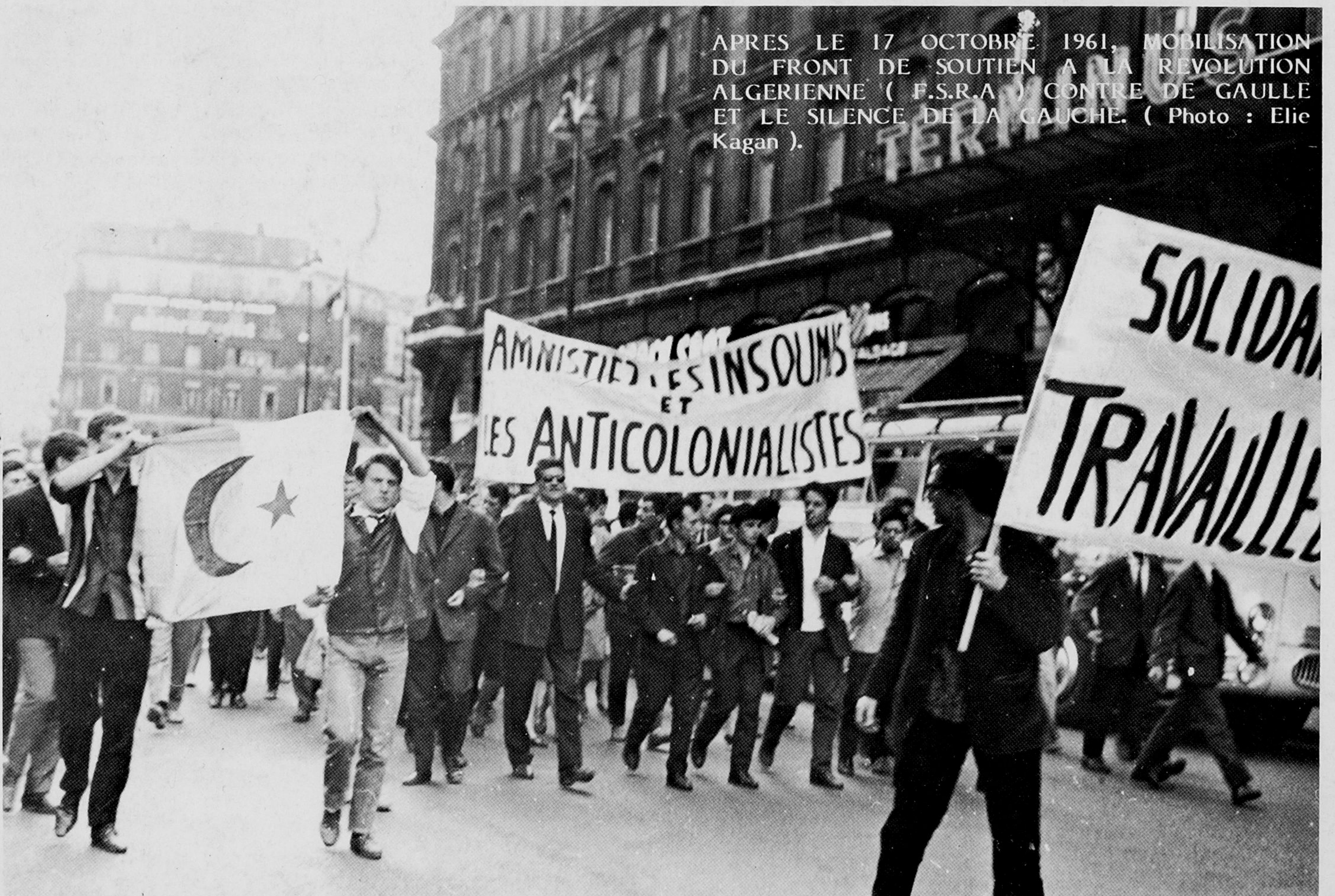
APRES LE 17 OCTOBRE 1961, MOBILISATION DU FRONT DE SOUTIEN A LA REVOLUTION ALGERIENNE ( F.S.R.A ) CONTRE DE GAULLE ET LE SILENCE DE LA GAUCHE. ( Photo : Elie Kagan ).