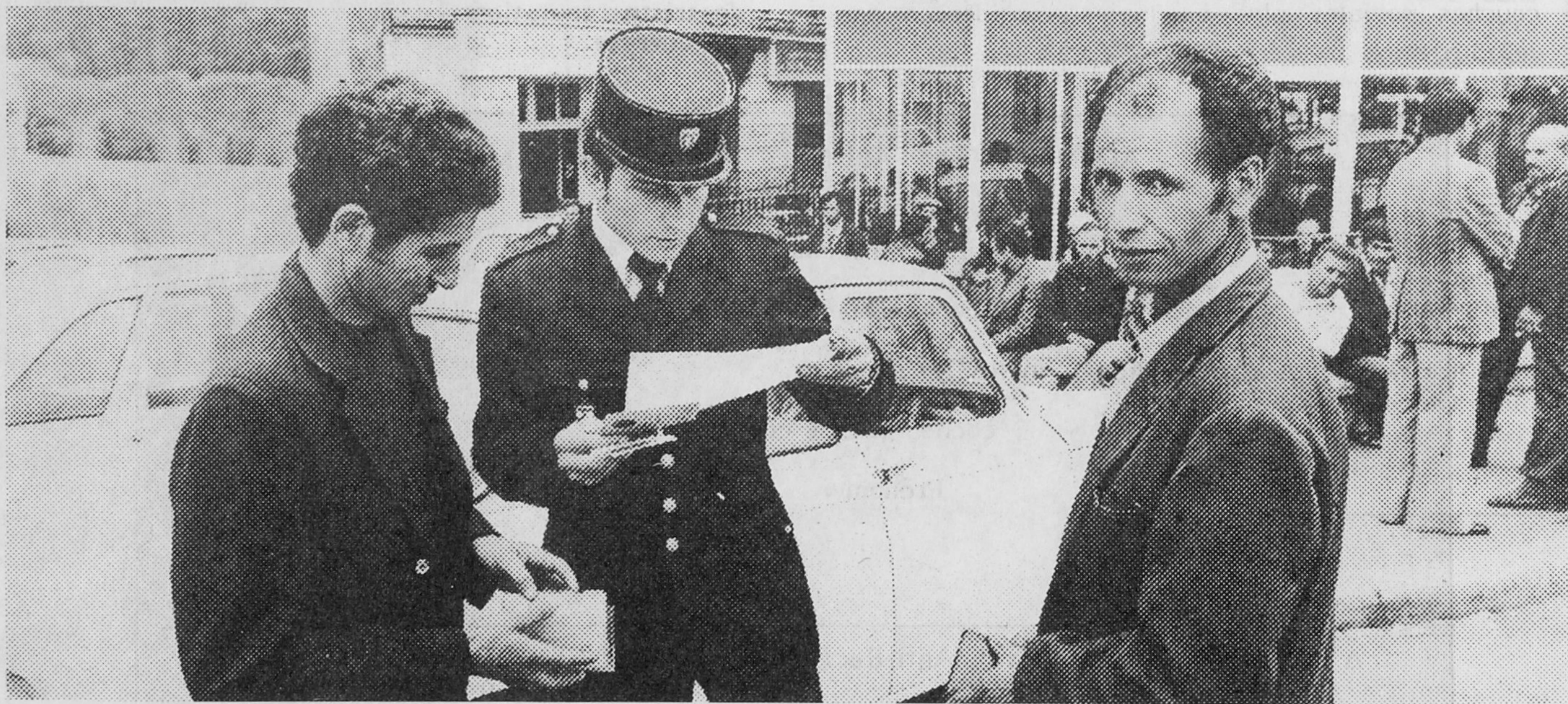
La multiplication des contrôles entraîne la montée du racisme

* Engager un processus anti-raciste d'unité jeunes/adultes dans les cités de banlieues, afin d'obtenir l'isolement et le désarmement des racistes, l'arrêt des tensions et un respect entre communautés nationales.