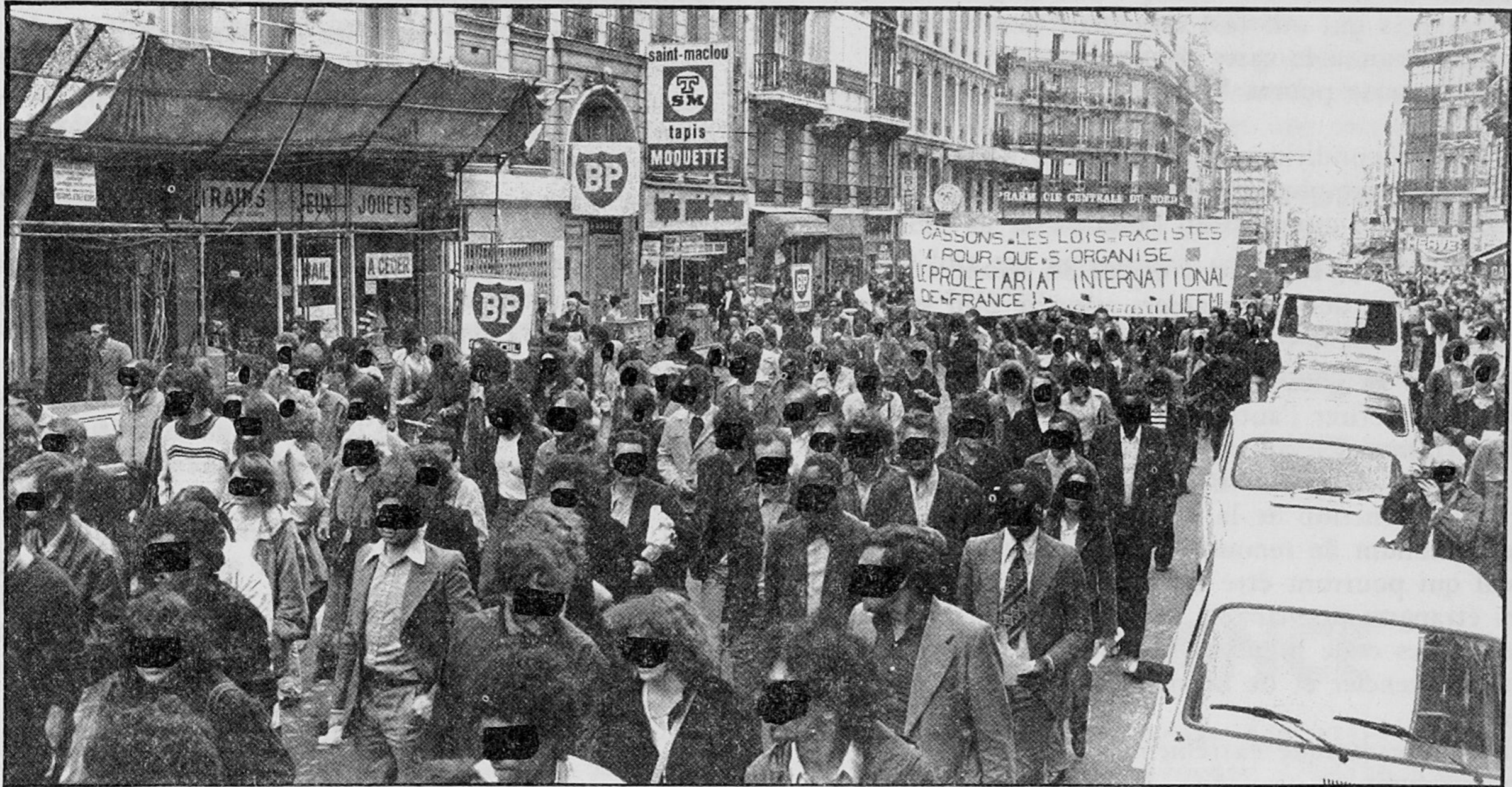
Développer un large mouvement d'opinion publique anti-raciste dans la voie ouverte par la manifestation du 16 Juin 1979.

Le gouvernement veut faire voter par le Parlement et le Sénat trois lois :