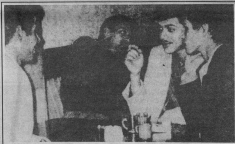
Entre le café...

« J'ai raté mon bac lettres l'année dernière, je ne savais pas où aller, alors j'ai fait un stage de quelques mois et maintenant j'enseigne... » Les jeunes qui arrivent à surmonter les obstacles du cycle primaire et secondaire et qui ont la chance de suivre une scolarité normale sont fixés sur l'horizon bac, sans trop d'illusions pour la plupart, car les taux de réussite sont faibles et la sélection draconienne. Même les heureux élus appréhendent « l'après-bac ». « Où aller une fois le diplôme obtenu, que faire ? S'inscrire à l'université ? Encore faut-il pouvoir trouver une section de son choix et non pas une orientation d'office. Et puis c'est trop long et il y a peu de débouchés avec la crise... », déclarent