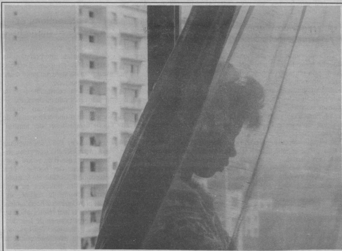
La jeune fille d'origine maghrébine refuse sa situation de recluse.

grarçons. Elles passent souvent leurs vacances à faire des travaux ménagers. Leur intégration paraît plus difficile parce qu'elles subissent fortement le poids des familles. Au niveau des femmes adultes, on assiste à des modifications de comportement. Certaines sont conduites par leur filles à suivre des cours d'alphabétisation pour essayer de dépasser l'univers familial. Par ailleurs, il faut noter que les femmes n'ont pas un statut autonome par rapport à la législation des étrangers. Elles sont subordonnées au droit de séjour et de travail de leur mari. Le regroupement familial, par exemple, est l'un de ces aspects. Très souvent en situation de dépendance économique, elles subissent les effets désastreux des retraits de titre de séjour et autres refus de renouvellement.