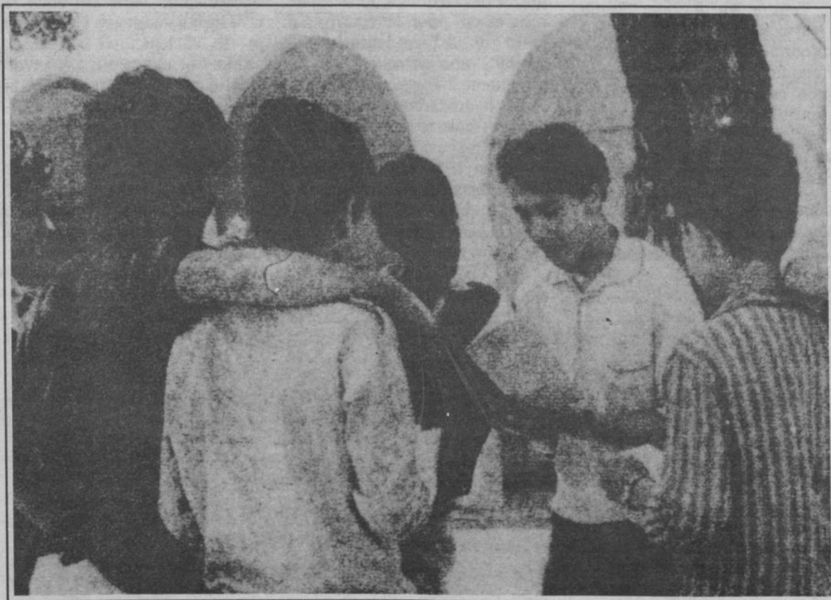
... et la rue, les jeunes n'ont guère le choix.