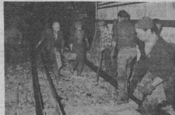
Victoire chez « les poseurs de voies » après deux ans de luttes.