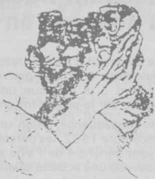
INCA CGT CGIL

Renouvelé sans interruption depuis 1958 l'accord CGT. CGIL.INCA. constitue la démonstration éclatante du sérieux et l'efficacité de l'engagement syndical commun entre deux confédérations nationales pour la défense sociale des travailleurs migrants. Il est encore unique en son genre.