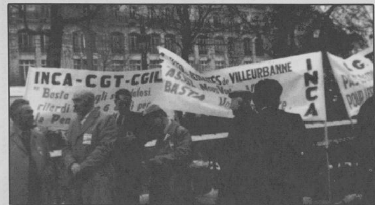
On reconnaît sur la photo la délégation INCA-CGT-CGIL représentant les retraités italiens du Rhône.