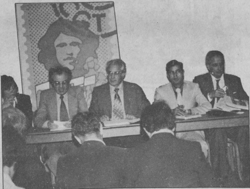
Conférence de presse, le 24 juillet, des avocats délégués par la C.G.T. et la C.F.D.T.