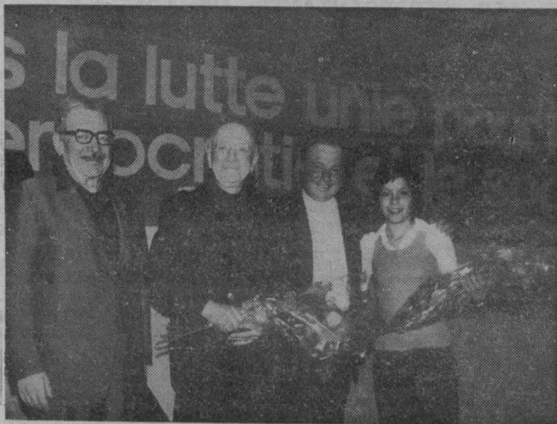
A gauche, Benoît FRACHON au 38 ème Congrès.

Le 11 mai, la Direction Confédérale de la C.G.T., avec de nombreux militants, étaient rassemblés dans une atmosphère de chaude fraternité pour témoigner à notre camarade Benoit Frachon leur profonde affection à l'occasion de son 80 ème anniversaire.