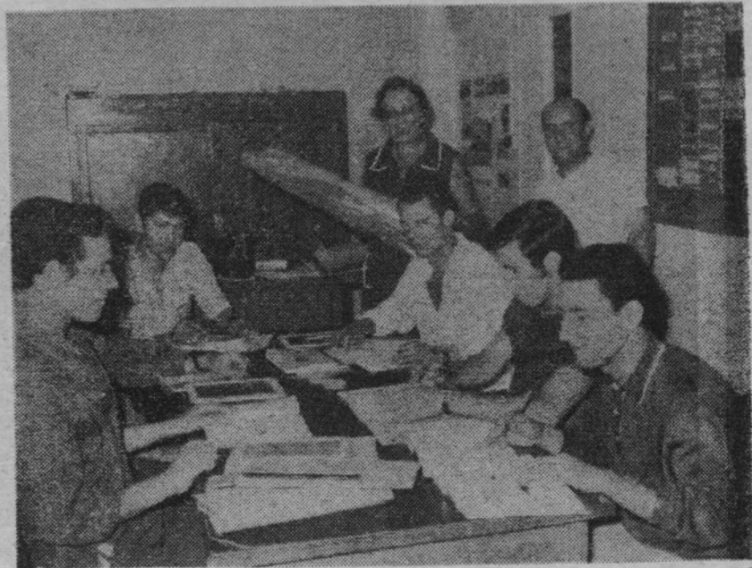
Un cours d'alphabétisation organisé par la C.G.T. pour les travailleurs algériens des Raffineries de Saint-Louis, dans les Bouches-du-Rhône.

دروس رفع الأمية عن العمال الجزائريين بمعامل السكر سان لوي (مقاطعة بوش دي رون)