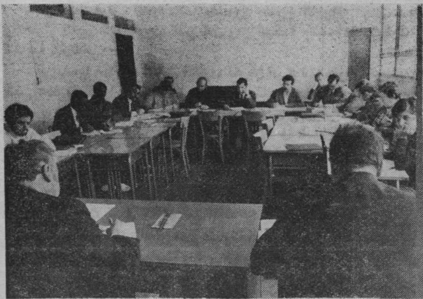
Stage national de formation de moniteurs au Centre Confédéral d'éducation ouvrière de la C.G.T., à Courcelles-sur-Yvette.

« Au titre de l'année scolaire 1968-69, sur 8.180 demandes de bourses,