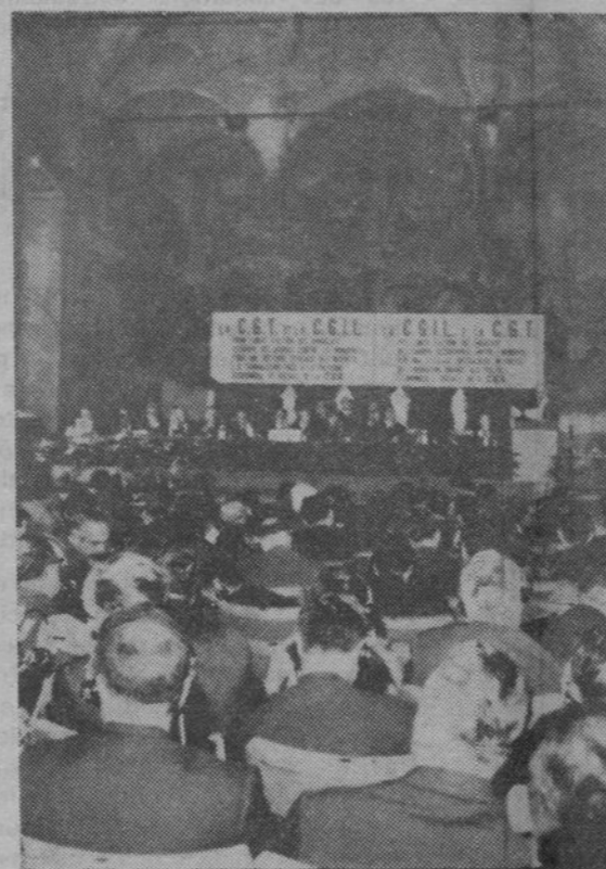
La salle de la conférence