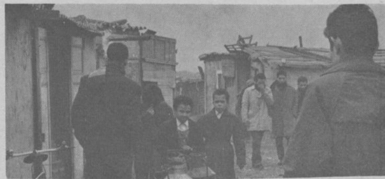
Reloger les travailleurs actuellement dans les bidonvilles.

Mais également de se préoccuper de la montée des cadres immigrés dans le mouvement syndical à tous les échelons et de développer les permanences pour la défense sociale des travailleurs immigrés et de leurs familles; ainsi que d'organiser des stages d'éducation réservés uniquement aux travailleurs immigrés; introduire la question de la main-d'œuvre immigrée dans les programmes d'éducation des organisations intéressées et de mener une campagne permanente et systématique de recrutement.