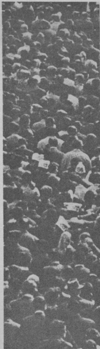
Les travailleurs immigrés participent largement aux luttes.

Après avoir analysé les causes de l'immigration et montré comment la politique du gou-