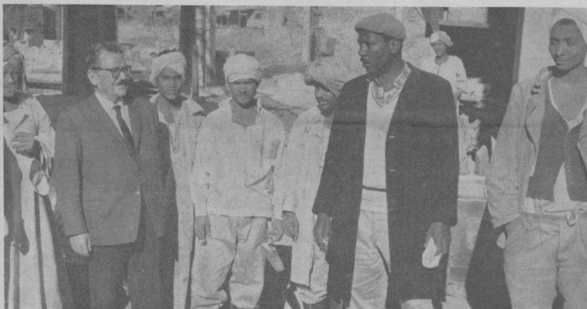
Benoît Frachon avec les travailleurs du haut-barrage d'Assouan.

ولا يمكن أن يدع الناطقون باسم الرأسماليين مثل هذه الفرصة الحسنة تمر دون القيام بدورهم . وينبغي علينا حالا وبدون اضاءة الوقت بذل قصارى الجهد في كل مكان يوجد فيه نازحون لافشال هذه المناورات وخلق ظروف تعايش أخوي بين كل العمال ورفع الاقنعة عن وجوه اصحاب الحملات العنصرية .