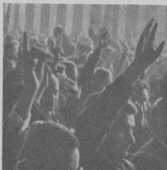
Voté à l'unanimité.

Certes — souligne le texte adopté — les travailleurs immigrés sont intéressés par les revendications d'ordre général (augmentation des salaires, réduction de la durée du travail sans perte de salaires, défense de la Sécurité Sociale...) Mais ces revendications générales seront d'autant plus sensibles à la main-d'œuvre immigrée que les discriminations dont elle est victime, seront combattues. Les conventions collectives doivent assurer l'égalité des droits pour tous.