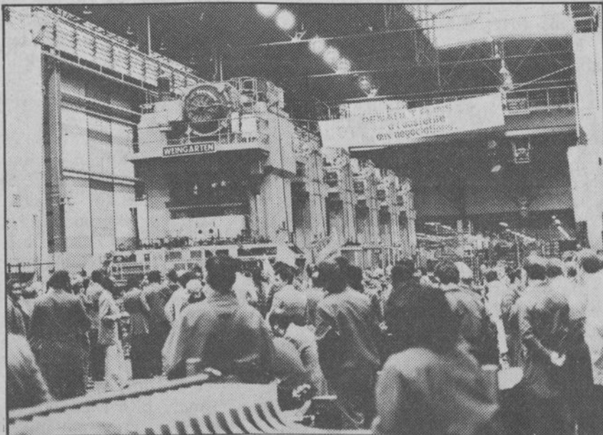
CGT için fabrikalarda yalnız bir mücadele var : Ücretler, çalışma şartları, özgürlükler, bütün günler geçen hayat için, aileler, tatiller... HER YERDE EMEKÇİLERİN HAK VE ÇIKARLARINI KORUMAK.