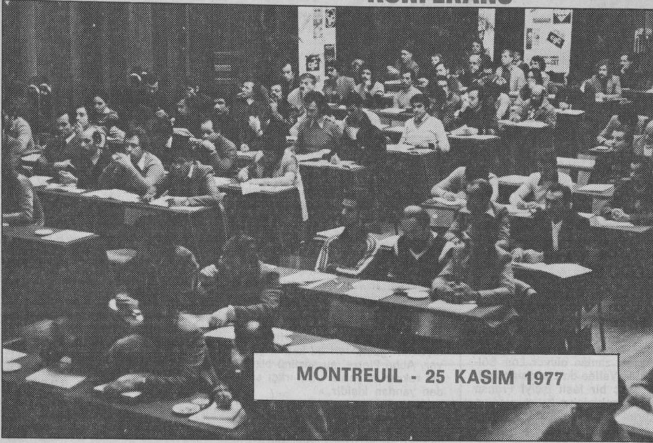
MONTREUIL - 25 KASIM 1977

Ulusal Konferans 10 delegesi kadın olmak üzere 150 delegıyla toplandı.