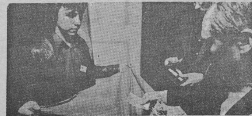
NA COLECTA FEITA NO CONGRESSO 2435 Fr. FORAM ENTREGUES ÀS COMISSÕES OPERÁRIAS DE ESPANHA.

● Para qualquer informação complementar, podeis consultar o « GUIDE DU MILITANT POUR L'ACTION » sobre o direitos dos trabalhadores imigrados, livro indispensável (editado pela C.G.T. ao preço de 10 francos nos nossos sindicatos e uniões locais).