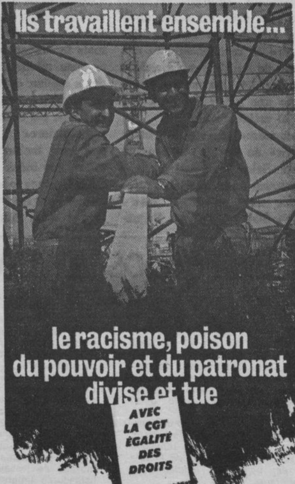
● Fotografia de um cartaz contra o racismo editado pelo (serviço de propaganda) da C.G.T. no quadro da preparação da IV Conferência Nacional sobre os problemas da imigração.