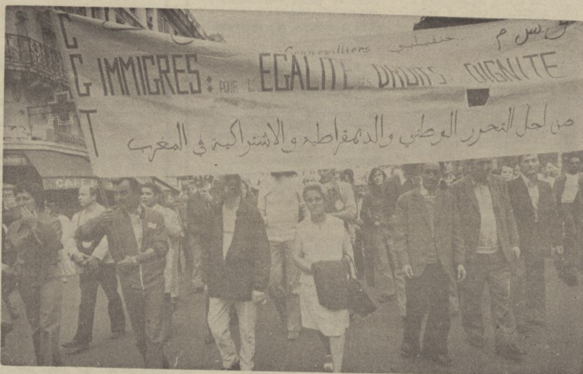
Trabalhadores franceses e imigrados manifestam-se em conjunto. Lies não querem ser as vítimas de uma política, que não são responsáveis.

Giscard d'Estaing dera-se 500 dias para efectuar profundas reformas, destinadas a mudar a sociedade e a melhorar radicalmente as condições de existência dos trabalhadores.