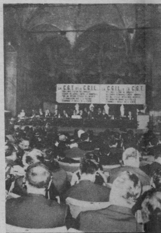
A sala da conferência.