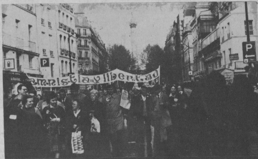
UNA GRAN PARTICIPACIÓN DE LOS INMIGRADOS ESPAÑOLES EN LAS MANIFESTACIONES DEL 1º DE MAYO.

« La carta reivindicativa de la C.G.T. prevé la reinserción en el país de origen de aquellos inmigrantes que lo deseen. Pero esa reinserción debe ser precedida de una formación profesional de regreso, con la garantía de la preservación del conjunto de los derechos adquiridos en materia de salarios y de cobertura social ».