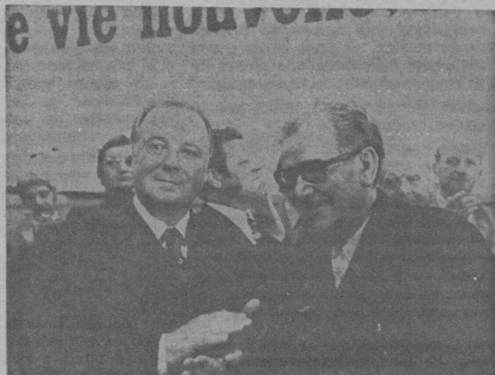
Georges Séguy y Benoît Frachon.

Redoblabremos de energía en el combate contra todas las manifestaciones y todas las formas del racismo. Lo haremos, no solamente por solidaridad obrera hacia nuestros hermanos inmigrados, sino también en conformidad con nuestros propios intereses de clase ».