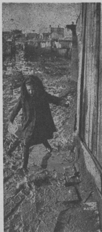
Panorama de un bidonville.

Sobre todo en materia de salarios, con el derecho al trabajo, el respeto de los contratos, la igualdad de salario real y de calificación para un trabajo igual al de la mano de obra nacional, deben garantizarse a los trabajadores inmigrantes —recalca la resolución— los beneficios sociales reclamando la igualdad de derechos para los trabajadores inmigrantes, cualesquiera que sean su origen y el lugar de residencia de su familia, sin ninguna discriminación.