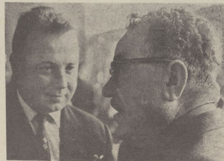
De izquierda a derecha: Benoît FRACHON, Presidente de la C.G.T. y Georges SEGUY, el nuevo secretario general.

Su intervención fue calurosamente aplaudida.