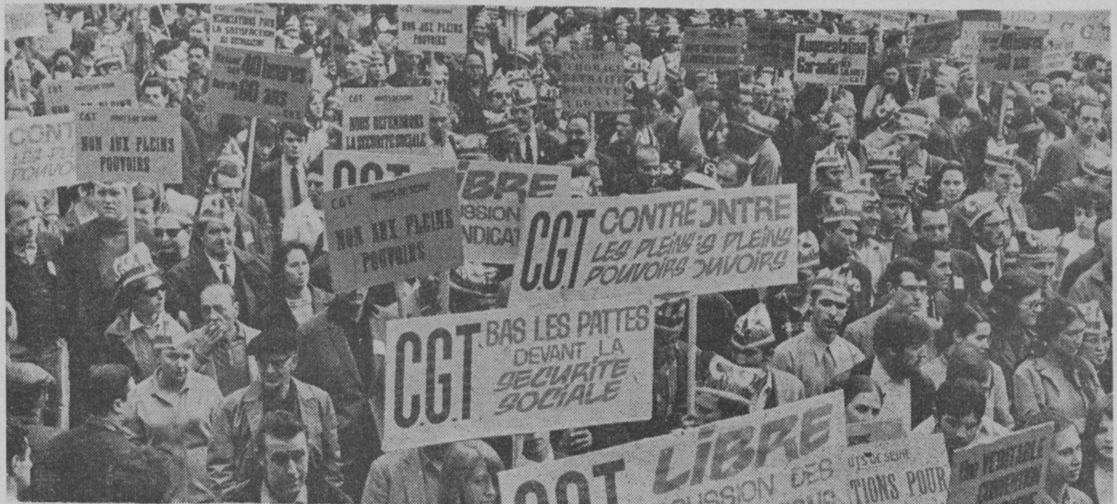
17 DE MAYO: PRIMERA RESPUESTA EN MASA DE LOS TRABAJADORES CONTRA LOS PODERES ESPECIALES

En la manifestación participaron numerosos trabajadores españoles.