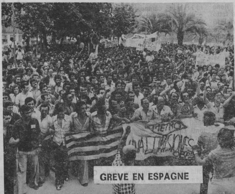
GREVE EN ESPAGNE