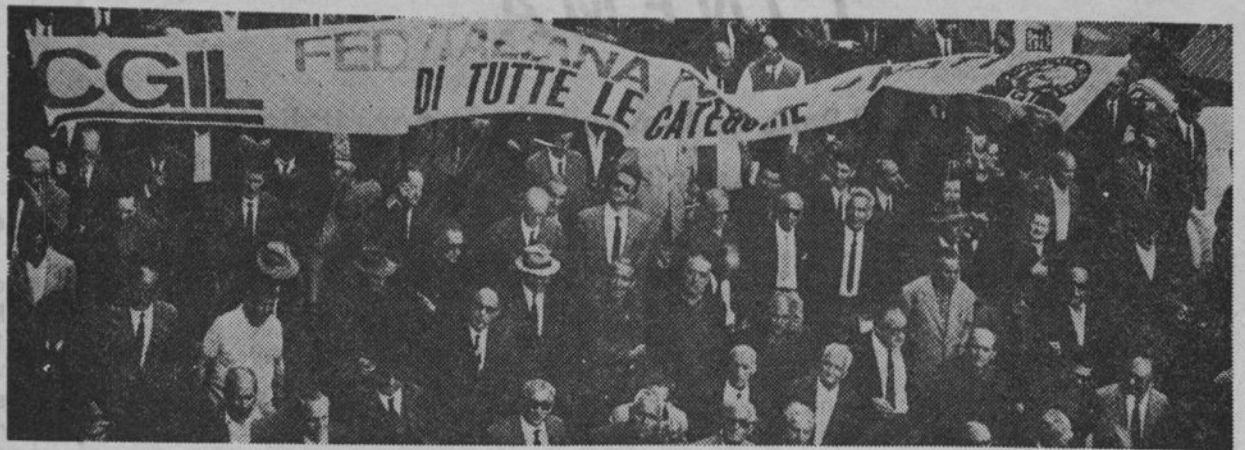
Nella foto: una recente manifestazione di pensionati INPS in Italia.

QUESTI GLI AUMENTI DELLE PENSIONI I.N.P.S.