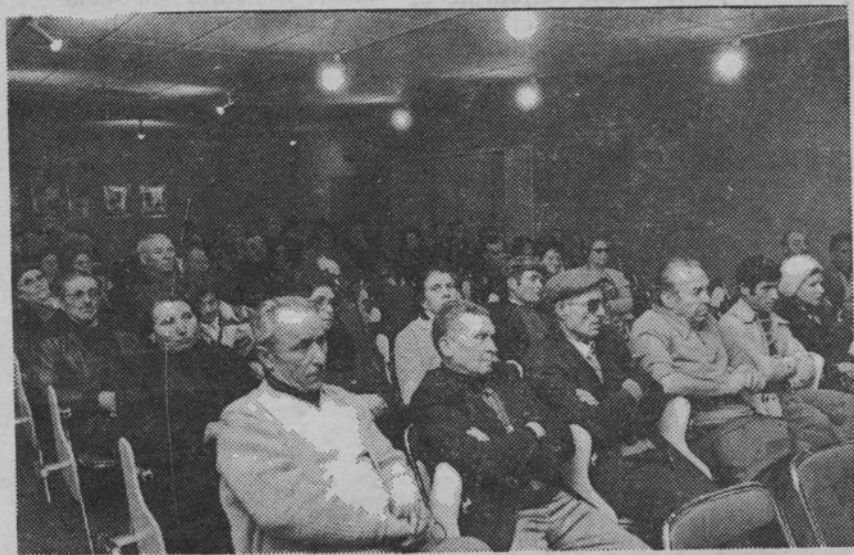
● Con le personalità, i giornalisti...

In occasione dell'inaugurazione della nuova sede dell'Ufficio Regionale I.N.C.A.-C.G.T. - Provence-Côte d'Azur, il Comitato Regionale e l'Unione Dipartimentale C.G.T. hanno organizzato un'operazione « I.N.C.A.-C.G.T. Portes Ouvertes ».