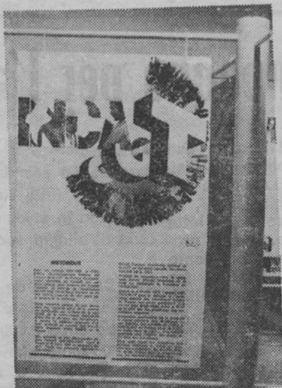
● Un pannello dell'esposizione sulle attività dell'INCA...

Questo il significato dell'attività dell'INCA-CGT, cio' emerge anche nei commenti della stampa locale sull'iniziativa del 24 Novembre « INCA - Porte Aperte » a Marsiglia.