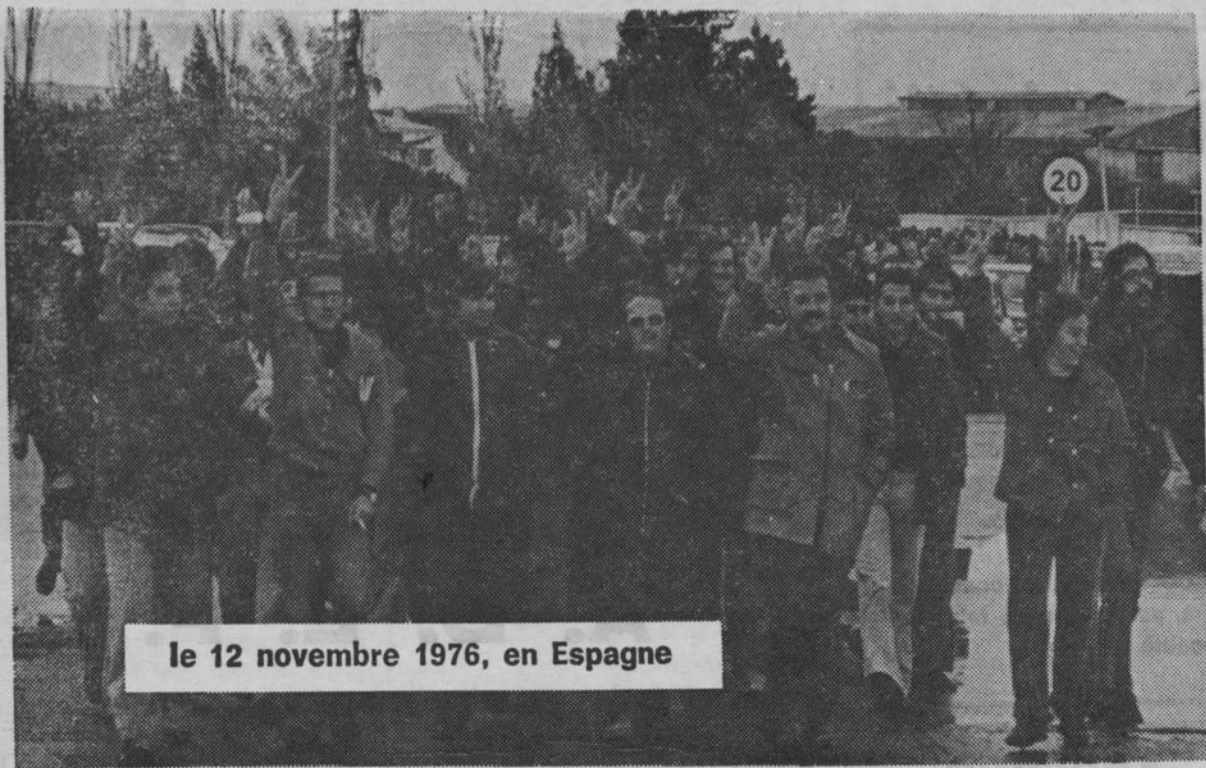
le 12 novembre 1976, en Espagne