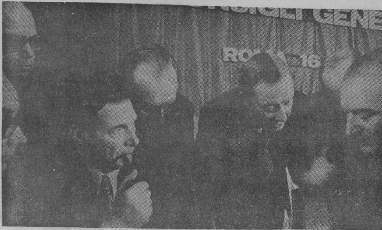
Nella foto: I segretari generali della CGIL - CISL - UIL. E altri dirigenti sindacali.