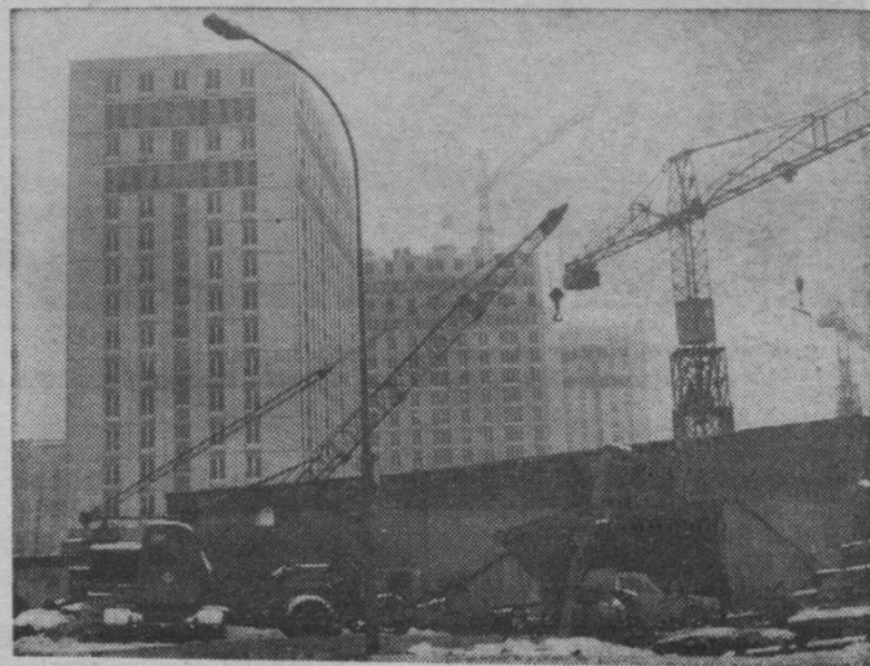
Il ritmo delle costruzioni non supera i 400.000 alloggi all'anno.

E' vero che il problema dell'alloggio non concerne soltanto gli immigrati, numerose sono le famiglie che non tro-