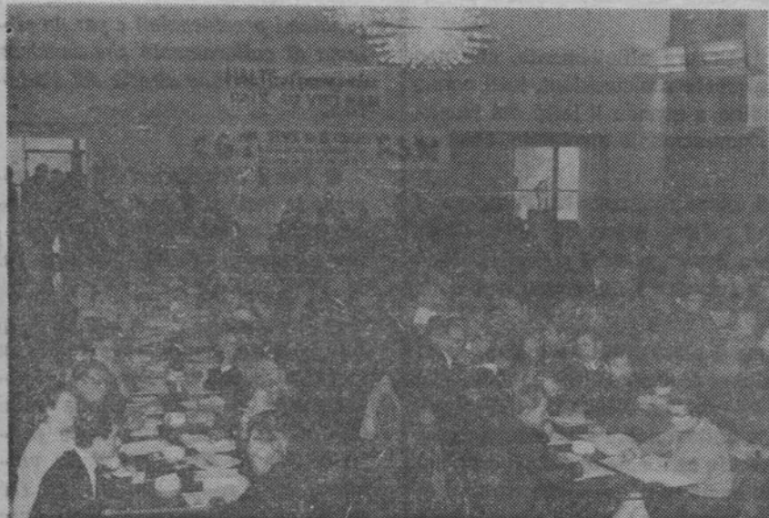
La sala del Congresso.

formazione professionale nelle loro lingua materna, in vista di garantirgli la riconversione professionale.