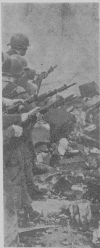
Il viso del « Mondo-Libero » U.S.A. 1967.

Una repressione violenta si è scatenata agli Stati Uniti contro le masse popolari Nere che rivendicano il diritto ad una vita decente.