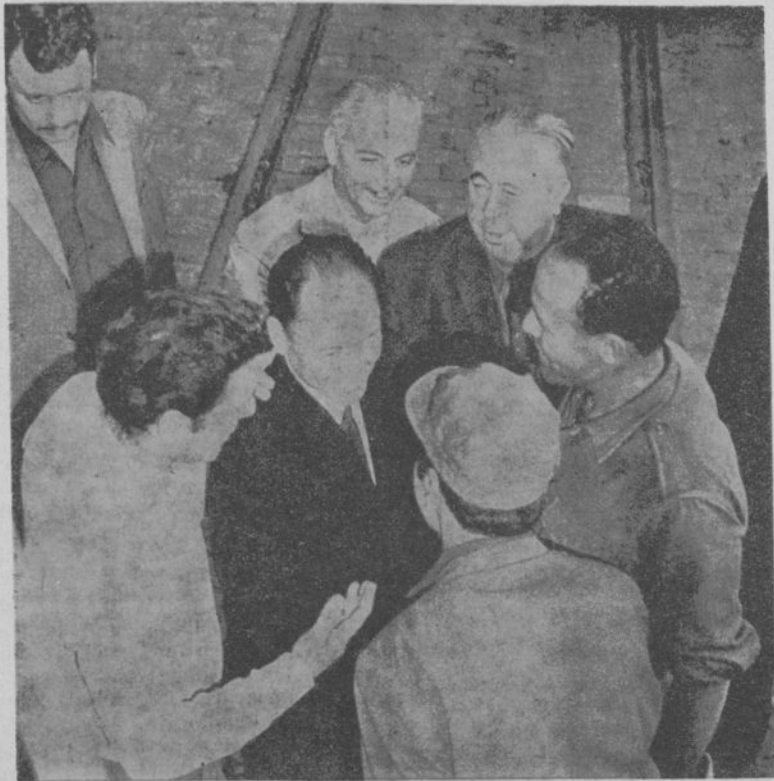
Il presidente della delegazione vietnamita in discussione con un gruppo di operai durante il suo soggiorno in Francia.

Il Movimento della Pace ha annunciato che « conformemente alle decisioni della Conferenza di Stoccolma per la pace al Vietnam e solidarizzandosi coi pacifisti americani che prevedono, a questa data, una grande manifestazione a Washington, il Movimento della Pace compierà gli sforzi indispensabili per fare del 21 ottobre una grande giornata d'azione per la pace al Vietnam e per l'indipendenza del popolo Vietnamita ».