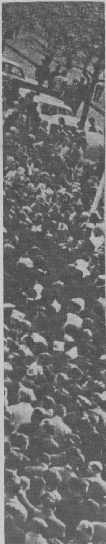
« I LAVORATORI IMMIGRATI, PARTECIPANO LARGAMENTE ALLE LOTTE RIVENDICATIVE ».

E' per questa ragione che il XXXVI° Congresso chiama le organizzazioni sindacali a considerare le rivendicazioni particolari enumerate qui-sopra come parte integrante del loro