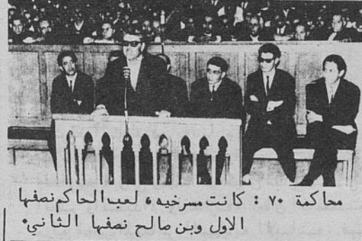
محاكمة ٧٠ : كانت مسرحية ، لعب الحاكم نصفها الأول وبن صالح نصفها الثاني.

في الواقع مشروع بن صالح عاش بالدولار و بفلوس الامبرياليين و عطى مفاصل الاقتصاد متاعنا في يدين الامريكان اللي ولاؤهم هوما الفائقين القاطنين و ما تترجح حاجه الا بعد لإرادتهم . آس حلي بن صالح وقت اللي فاق عام ٦٩ بالماء يلعب تحت رجليه لقي روحو غارق مع الامريكان للعنكوش ببيع يهبطوه و يبيع يطلعوه و بمجرد ما ماك نمارا قص عليه العلفه و البنك العالمي رفض يعطيه القروض اللي طلبها لتعاوضاتو لقي روحو يعوم في التاشف و طاح هو و برناجو طيحه ما قاموش منها . وقتها عاد زادو الامبرياليين قوا في النعمة و هذا شي طبيعي . سي بن صالح عظامه المفاتيح ، و جاء سي نويرة حليم البيبان . ساهل ياسر على سي بن صالح يقول اليوم اللي الامبرياليه تزترع توه في تونس و تنهب فيها اكثر من قبل . هذا صحيح و ماكد لكن في الواقع سياسة نويرة ورتت التركة من سياسة بن صالح . هاذي هي الحقيقه اللي يجب يدركها بن صالح و يجب يعيدتها في تصريحو في المنعوتة . شبيه مثلا ما قالناش شبيه هي الامبرياليه اللي تلب في البلاد اليوم و ما تمه حتى كلمه على دورها السابق في التخطيط متاعو شبيه ما تحفظ النكت على الحروف ويسمي الامريكان بأشهم و الفرانسييس و ماك نمارا و عصابتو . علاش التصريح متاعو غامض في النقطة هاذي و يمسح على الامبرياليه من الغوف لغوف و الازعمه ما تشار العيشه القديمه مع ماك نمارا .