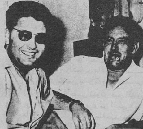
عام 01 : عاشور تامر على النقابه و بين صالح تغايل و وقتر .

و بعد هذا و دون ما ننسا و نسا و نسا بن صالح توه في الخارج و عمل التصريح متاعو بعد هزبتو من الحبس : شجاعة وزيرنا السابق هذا كل حدها : قدام المحكمه و في الحبس تعمل "پتان" و تسكت ، و في اوربا ترجع تخدم . اما اذا بورقيبه بيد العما بمنصب في الوزاره وقتها لا عاد شجاعه و لا والو . الريفه تيسل و بن صالح بهبط على كلا كلو .