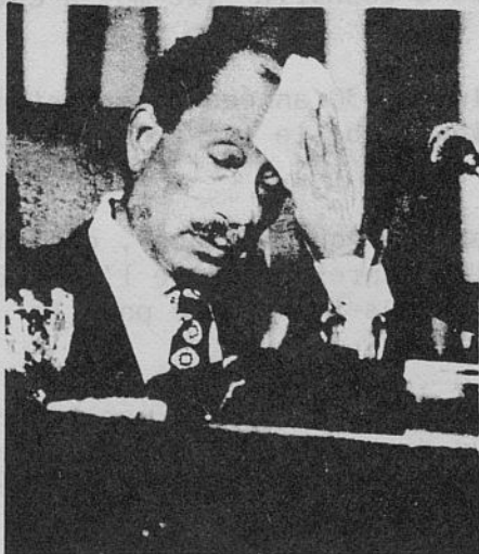
ANOUAR EL-SADATE. L'angoisse de la trahison.

Elle ne peut que s'indigner devant les paroles du gouvernement marocain qui, dans une déclaration de soutien à la visite de Sadate en Israël, lançait sans vergogne : "Imaginez le génie des israéliens et les ressources matérielles des arabes." Quoi de mieux pour insulter les peuples arabes, quoi de mieux pour appeler à la soumission capitulationniste!!!!!!