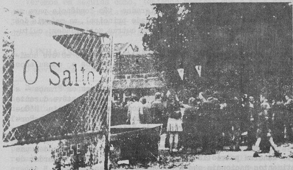
Os trabalhadores emigrados unem-se entre si na base das suas reivindicações específicas.