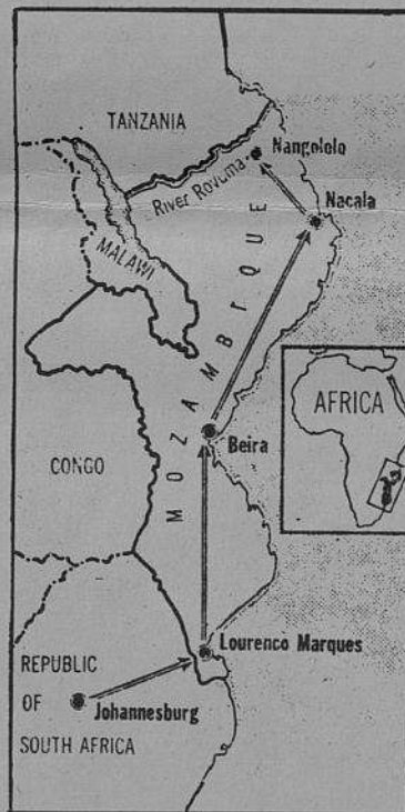
Trajeto seguido pelos aviões pulverizadores que lançam sobre as populações indígenas produtos tóxicos.

Segundo o semanário britânico « The Sunday Times », pilotos mercenários sul-africanos