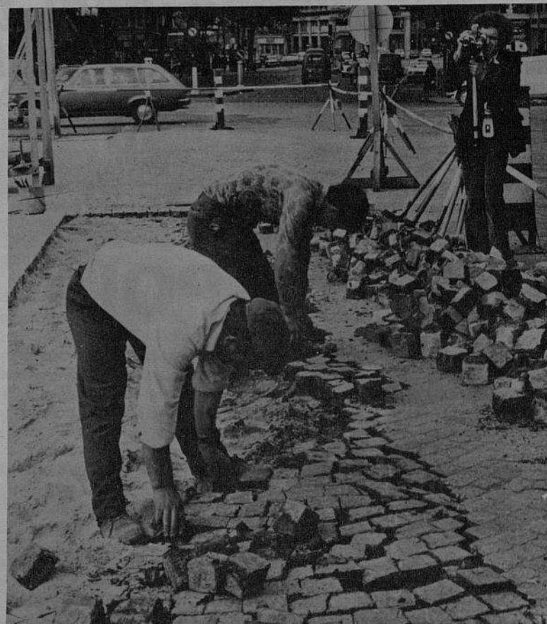
Um aspecto da rodagem, em Paris, dum filme dum cineasta português que vive na Suécia. O filme tem como tema a emigração portuguesa e será apresentado aos I Jogos Florais.

Esperamos que, por toda a parte, quer nos clubes, quer individualmente, os trabalhadores portugueses, estejam em França, na Bélgica, na Holanda, na Alemanha ou mesmo em Portugal, sigam o exemplo do Clube dos Jovens Trabalhadores Portugueses de Paris e se preparem activamente para os I Jogos Florais da Emigração!