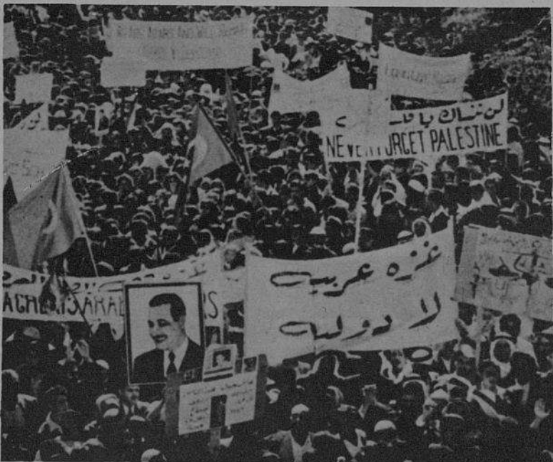
O povo do Egipto, forte das suas tradições nacionalistas, saberá encontrar, no exemplo do povo palestiniano o caminho a seguir.

É necessário salientar que a soma da pensão satisfaz as necessidades de vida. Por outro lado, na Albânia não se paga qualquer imposto ou taxa. Os alugueres são dos mais baixos do mundo, o serviço de saúde, o ensino e outros serviços sociais são gratuitos. Desta forma evita-se, na Albânia, o desequilíbrio entre as condições de vida do cidadão que trabalha e aquele que deixa o seu trabalho devido à velhice ; este desajustamento é uma característica da maior parte dos países da Europa capitalista.