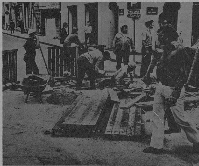
Em Paris, no mês de Agosto, os trabalhadores portugueses emigrados continuam a construir.

De facto, tudo está organizado de maneira a que o trabalhador esteja o mínimo de tempo ausente do trabalho. Mesmo quando se pode partir durante um mês, quando se volta, o ritmo de trabalho aumenta, os preços aumentam, os transportes aumentam ; mas os salários, esses, continuam na mesma !