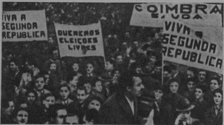
Em 1949, manifestação popular durante a campanha eleitoral de Norton de Matos

Apresentamos ao lado um quadro que mostra bem que nas zonas mais politizadas do País se verificou o maior número de abstenções ( e isso entre 1.809.780 inscritos, o que nem chega a 22 % do total da população ).