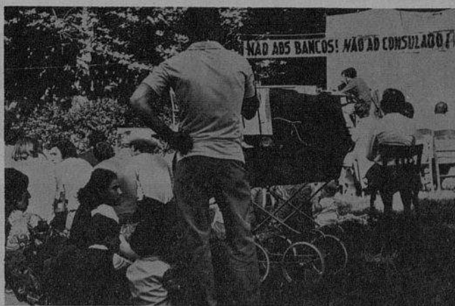
Alguns aspectos da final da Taça da União e da Festa de 14 de Julho