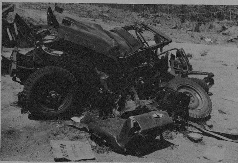
Jeep Willys destruído pelas forças de libertação. A venda de jeeps é uma das formas do criminoso apoio dado pelo imperialismo americano ao colonialismo português.

A mesma fonte de notícias informa que os pilotos recebem por dia 4.062,50 escudos por duas horas de voo, mais 1.950 escudos por cada hora de voo suplementar, soma a qual se vem juntar um « prémio de risco » da ordem de 20 %.