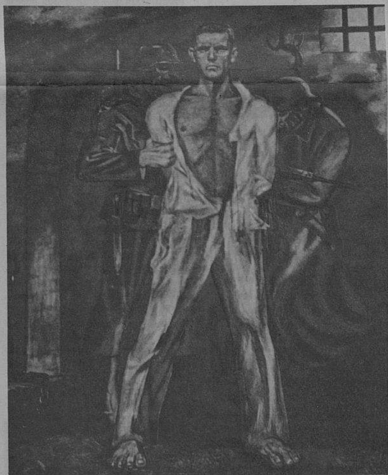
Quadro a óleo do artista albanês Leç Shkreli. Esta obra foi consagrada ao herói popular Manush Alimani que se conservou sempre firme perante as torturas atrozes dos fascistas. (Galeria das Artes, Tirana).

Movimento dos Trabalhadores Portugueses Emigrados 56, Rue de la Fontaine-au-Roi 75 - Paris 11 e me