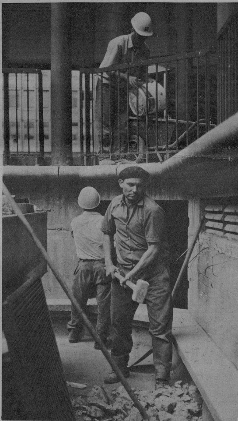
Não serão as eleições que farão acabar com a situação que nos leva a emigrar