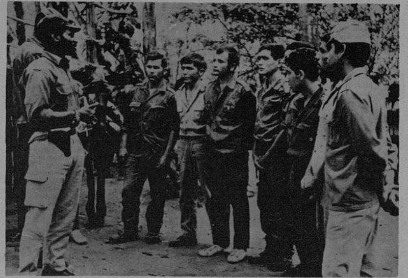
Samora Michael, presidente da FRELIMO, recebe desertores portugueses. Desertar é uma forma de apoiar a luta dos povos de Angola, Guiné e Moçambique.

Esta notícia foi publicada pela Frelimo num comunicado de guerra em Dar-es-Salam no dia 18 de Julho de 1972. Além disto, notícia igualmente que, a 15 de Março, os colonialistas atacaram uma das suas bases na região de Mocumbura com tropas transportadas em helicópteros. Durante a operação, um helicóptero colonialista foi abatido pelas suas armas anti-aéreas, morrendo quatro oficiais fascistas. A 24 de Maio, um avião rodesiano de reconhecimento militar foi abatido na região de Magué, perto da fronteira rodesiana, quando tentava localizar as bases dos combatentes.