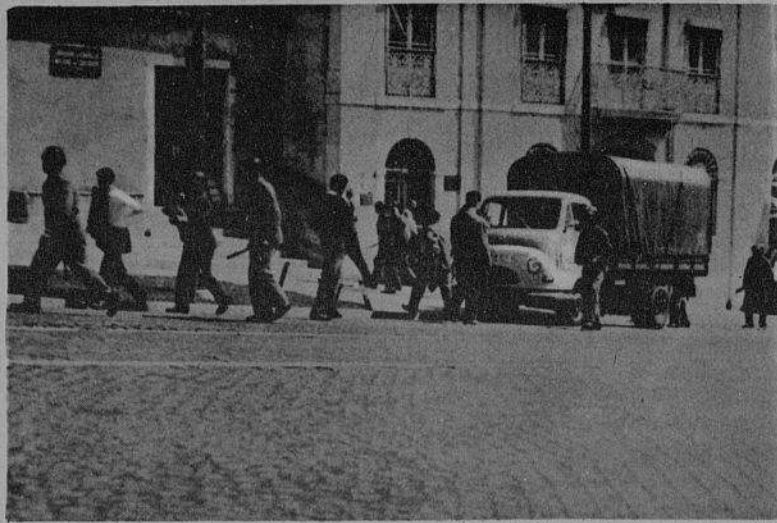
Em 1962, o povo português compreende que a violência revolucionária é a única via para se opôr ao fascismo.

Num sistema de democracia burguesa em que há liberdade de associação, de imprensa, de constituição de partidos políticos, eleições livres, etc., o proletariado deve servir-se destas liberdades para mostrar quanto elas são falsas e enganadoras, truncadas e limitadas, enquanto o poder político e económico estiver nas mãos duma minoria exploradora. De igual modo, em relação aos parlamentos da burguesia ( como, de resto, em relação aos sindicatos reaccionários ) deve a classe operária lutar no seu terreno com vistas a denunciá-los perante as massas como autênticas armas que são do inimigo de