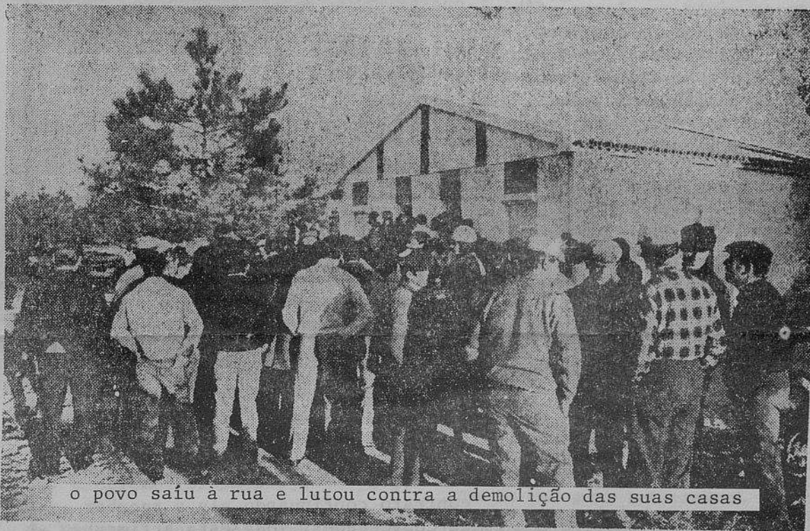
o povo saiu à rua e lutou contra a demolição das suas casas

As rendas das casa em Portugal são cada vez mais elevados o que leva à construção de casas clandestinas. Como já se passou na Brandoa, no Barreiro, etc.