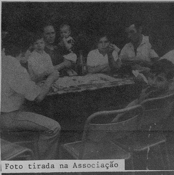
Foto tirada na Associação

LÊ, DISCUTE COM OS TEUS AMIGOS E ASSINA "O ALARME"