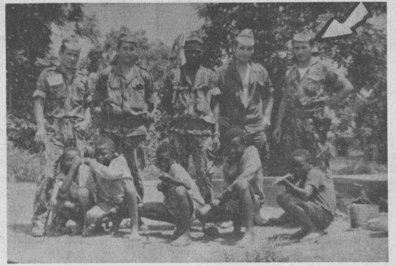
Os comandos ensinam as crianças a atirar sobre os seus irmãos de raça.

Talvez seja mais cómodo não querer saber mas é preciso saber e é preciso agir. Porque estes crimes são praticados em nome de Portugal.