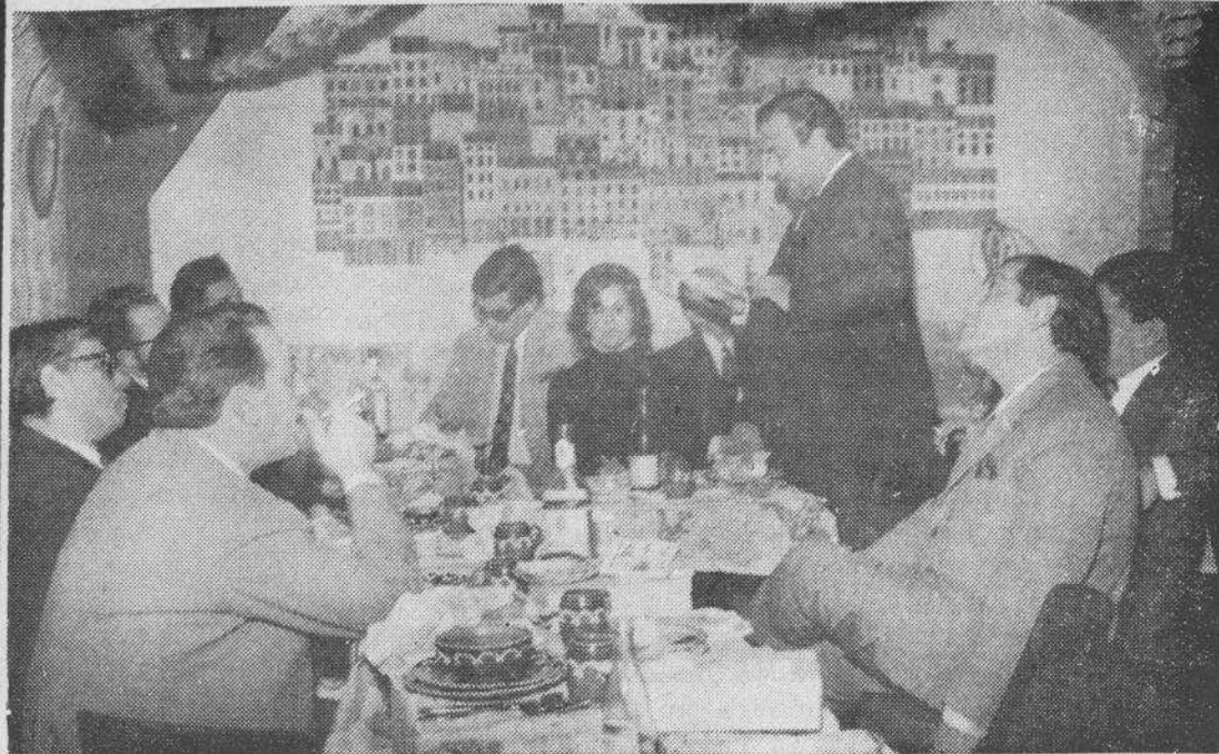
Um aspecto da reunião