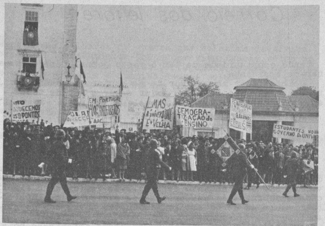
Quem adivinhar que este desfile de "fardas verdes" é para a inauguração duma universidade ganha um ponto. Como diz uma das pancartas certos professores foram expulsos assim como alguns alunos. Não é de estranhar pois era preciso dar lugar aos senhores de capacete e metralhadora na mão.