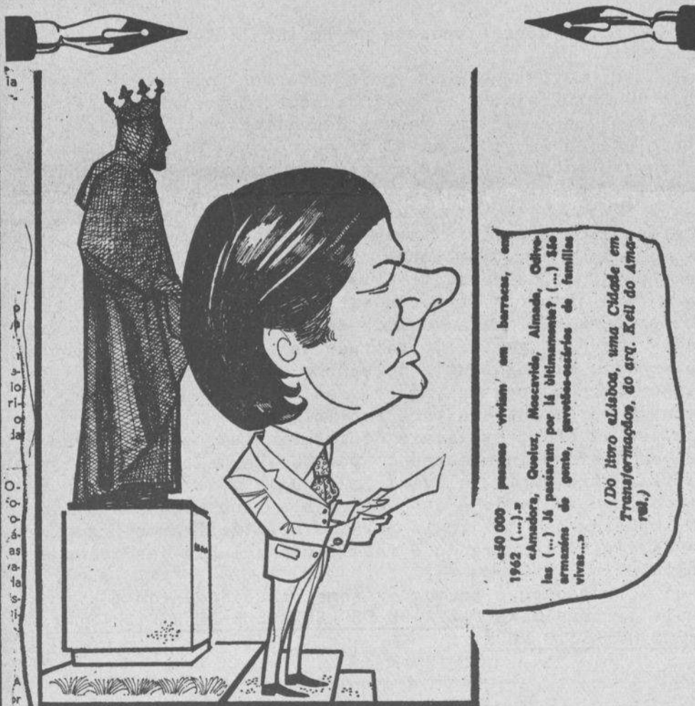
O Ministério da Justiça ofereceu a Leiria uma estátua de D. Afonso III

"Nós acreditamos em Jesus Cristo porque no nosso tempo os oprimidos libertam-se; os cegos começam a abrir os olhos; os que se calaram durante séculos começam a ter a palavra; os abandonados da sociedade começam a sentir a força da solidariedade. A boa nova, a justiça, é, a partir de hoje, anunciada aos pobres. Nós esperamos um homem novo, que nós reconhecemos em Cristo, e saudamos desde hoje todo o combatente da justiça e da liberdade!"