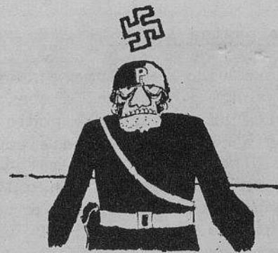
Desenho de V. Barão no C.F.

Após um decreto em que o governo limitava as actividades das cooperativas, foram fechadas a "Coordenadas" e a "Confronto" no Porto. Em Lisboa, a "Livrelco" foi fechada por 180 dias. Foram ameaçadas: a cooperativa "Devir", em Lisboa; a "Livrope", em Alverca; o "Centro Popular Alves Redol", em Vila Franca de Xira.