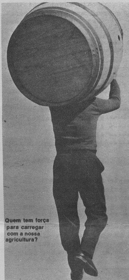
Quem tem força para carregar com a nossa agricultura?

Dos pequenos patrões um número mínimo passa a grande, a maioria passa ao proletariado. As classes médias estão condenadas. O futuro é acabar com o capitalismo e instaurar a sociedade socialista e proletária.