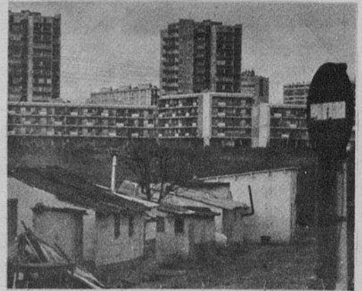
Massy: alojamentos para quem?

É preciso pois, que continuem unidos e que todos, sem excepção, sejam alojados nas casas que estão a ser construídas, que aliás o são com o dinheiro dos emigrantes, isto é, o dinheiro do F.A.S. (Fundo de Acção Social). (1).