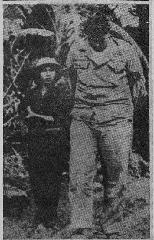
Os gigantes também caem

Para que o Vietname tenha independência e paz, precisa fazer a guerra ao invasor e pô-lo de lá para fora.