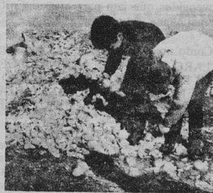
Na lareira são despejadas, quase diariamente, por uma fábrica de sumos e conservas de frutas, grandes quantidades de cascas e outros detritos, de mistura com laranjas, decerto consideradas inaproprias para os produtos preparados por aquela unidade fabril, que a paratada ao sítio não deixa de escolher e comer, com todos os perigos que não é difícil adivinhar.